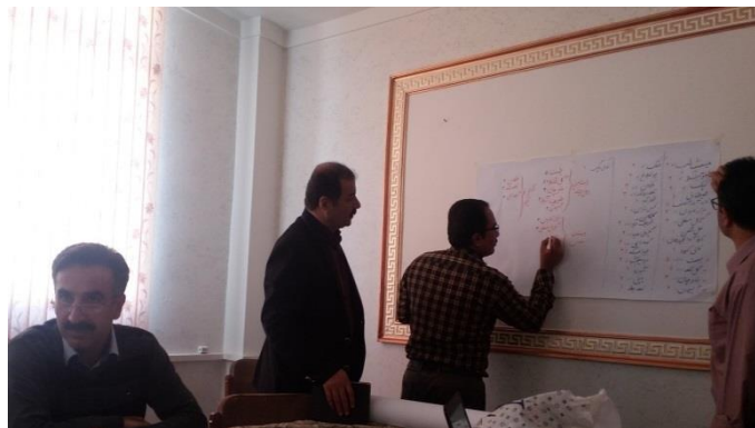
تصویر ۳. تعیین فراوانی روستاهای هدف